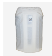
Sacca di protezione invernale